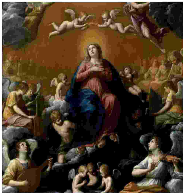
Guido Reni (1575-1642), «Assunzione e incoronazione della Vergine»

Rivelazione biblica, senso di fede del popolo di Dio, docenza magisteriale dei pastori, pensiero cre-