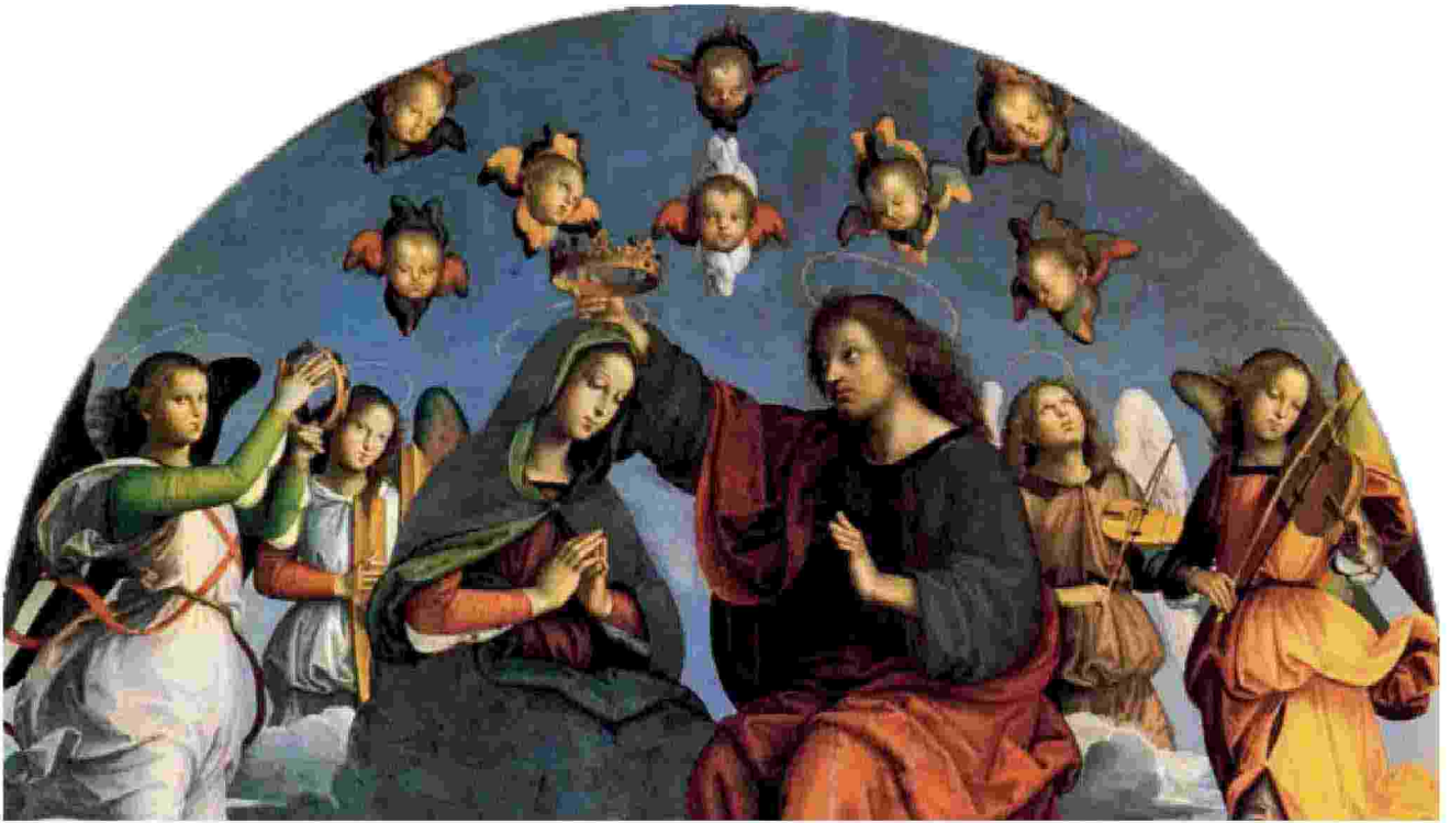
Raffaello, «Incoronazione di Maria» (Pala Oddi, 1502-1503)